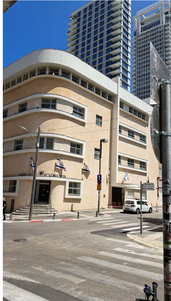
תל-אביב : בניין יבנה